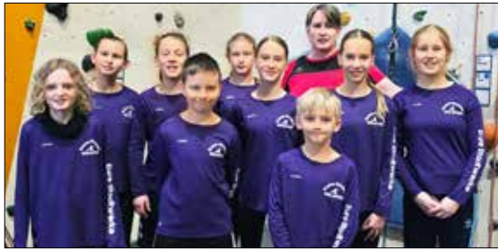
Die jungen Kletterkünstler unseres Vereins kehrten begeistert aus der Nordwand-Halle in Hamburg-Wilhelmsburg zurück.

Kanu-Jugend der Unterelbe-Vereine unterwegs: Gewinn bei „Wir von hier“ sorgt für besonderes Kletter-Erlebnis.