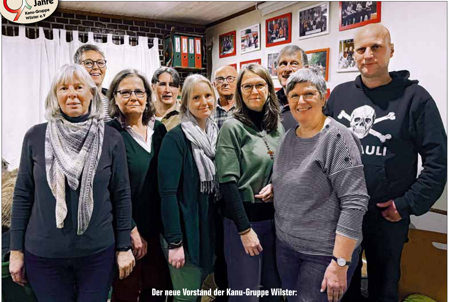
Der neue Vorstand der Kanu-Gruppe Wilster: