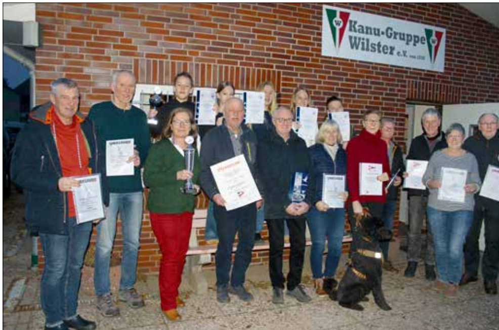
Die geehrten Vereinsmitglieder auf der JHV