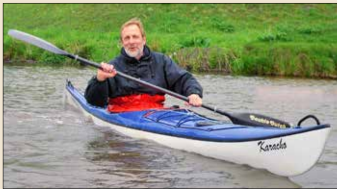
Bin immer noch gerne auf dem Wasser. Die HerrenTour ist ein Muss!

Wie Zufälle so spielen, entdeckte ich am Bootshaus einen ziemlich heruntergekommenen Holz-Zweier