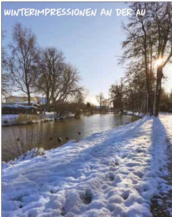
WINTERIMPRESSIONEN AN DER AU