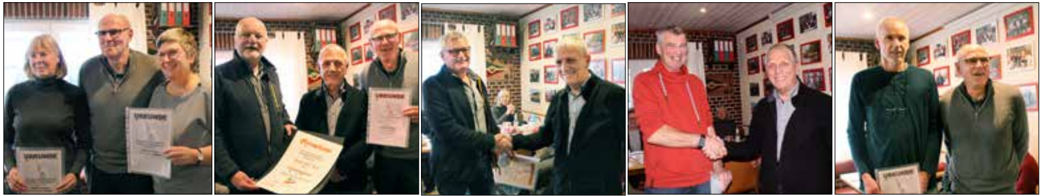
Ehrungen im Minutentakt... herzlichen Glückwunsch!

Daraufhin folgten diverse Ehrungen rundum den Erwerb des Wanderfahrrabzeichens sowohl im Schüler- und Jugend-, als auch im Erwachsenenbereich. Guckt hierfür einmal in den Statistikeil des KeKös. Es sollten Ehrungen für langjährige Mitglieder folgen, die nicht an bei der Weihnachtsfeier durchgeführt werden konnten.